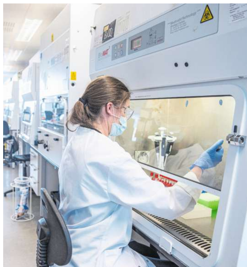
Die Astrazeneca-Impfung wurde in den Labors der Uni Oxford entwickelt.

Der Oxford/Astrazeneca-Impfstoff gehörte bereits seit längerem zu den vielversprechenden Kandidaten: So hatte die EU bereits vorab bis zu 300 Millionen Dosen davon bestellt. Auch die Schweiz hat sich Mitte Oktober bis zu 5,3 Millionen Dosen gesichert. Anfang Oktober hatte die Firma in der Schweiz ein Zulassungsgesuch eingereicht. Man wolle – nach den noch notwendigen Zulassungen – noch vor Jahresende mit