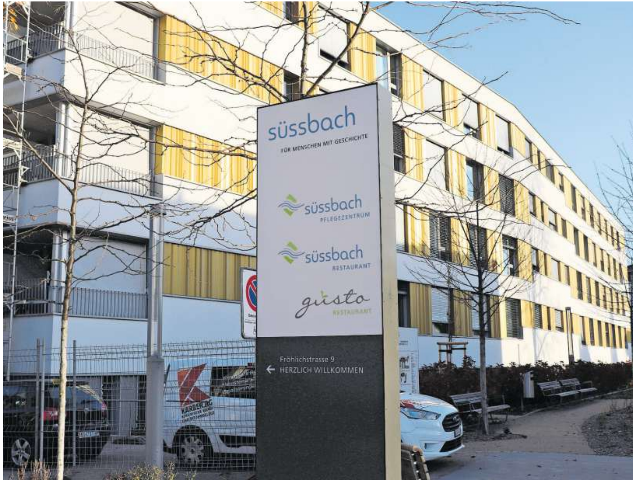
Das Pflegezentrum Süssbach an der Fröhlichstrasse ist aktuell nur teilweise geöffnet.

Seit dem 16. November stehen alle Bereiche unter den bisherigen vom Kanton geprüften Schutzmassnahmen wieder offen – ausser die beiden betroffenen Stationen. Diese und deren Mitarbeitende sind bis heute isoliert. «Wir hatten anfänglich ein Notfallkonzept, das 15 Infizierte auf einer Station vorsah. Das musste rasch angepasst und die Kunden auf den jeweiligen Stationen isoliert werden.» Denn die Zahlen stiegen schnell: Insgesamt gab es 50 Coronafälle, darunter 15 beim Personal. Drei Menschen verstarben in direktem Zusammenhang mit dem Virus.